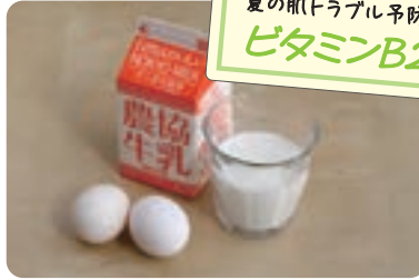
夏の肌トラブル予防に ビタミンB2

豚肉(ヒレやもも)や玄米、豆類、ナッツ類に多く含まれます。炭水化物をエネルギー源に変える役割を担い、疲労回復効果が期待できます。熱に弱く水に溶けやすいため、豚肉をスープなどにして煮汁ごと取るのがおすすめです。