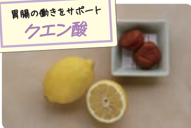
胃腸の働きをサポート クエン酸

肉や魚、乳製品、大豆製品などに多く含まれます。筋肉など体のもとになる他、脳の働きをサポートする効果が期待できます。脂質が少なく軟らかい豚ヒレ肉や白身魚は蒸し料理や煮込み料理にすると胃腸の負担が軽くなります。