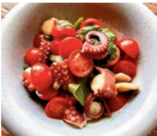
ミニトマトとタコと大葉のマリネ