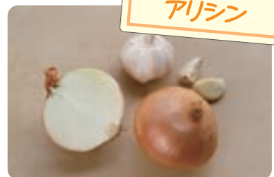
香りで食欲アップ アリシン

レモンなどのかんきつ類や梅干しなどに多く含まれます。胃酸の働きをサポートして食欲増進効果が期待できる他、タンパク質の吸収を促進する効果も期待できます。疲労回復をサポートする他、腸の運動を活性化させ便秘解消効果も期待できます。