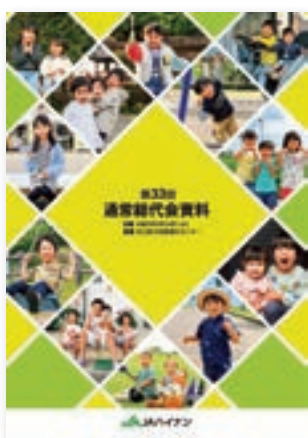
第33回通常総代会資料