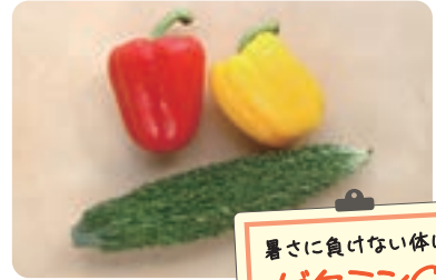
暑さに負けない体に ビタミンC

レバーや乳製品、卵などに多く含まれます。脂質の代謝を助け、成長期の子どもの成長をサポートする効果や、皮膚や粘膜の健康を保つ効果が期待できます。汗や皮脂が増える夏は肌トラブルも起こりやすいため、積極的に取りたいですね。