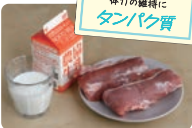
体力の維持に タンパク質

パプリカやゴーヤー、キウイなどに多く含まれます。免疫力アップや紫外線による肌のダメージ対策が期待できます。特に赤パプリカのビタミンCはレモンの約1.7倍の量で、加熱しても壊れにくいいため、炒め物などにすると良いでしょう。