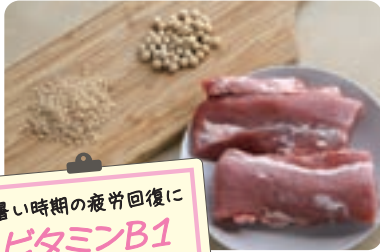
暑い時期の疲労回復に ビタミンB1

夏に不足しがちなビタミンやタンパク質に加え、食欲増進効果のある栄養成分も一緒に取ると良いでしょう。