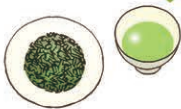
家庭用として親しまれる

最初の新芽が伸び出した頃から20日程度、日光を遮って栽培した葉。甘く豊かな香りで、うま味が強く、苦味や渋味が少ない