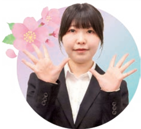
いけ がや かな う