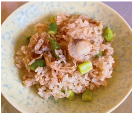
アスパラとホタテの 炊き込みご飯