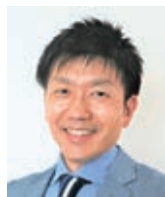
気象予報士・防災士 檀山 靖洋 ひやま やすひろ

1973年横浜市生まれ。 明治大学政治経済学部政治学科を卒業後、印刷会社に就職。 1999年に気象予報士を取得し気象会社へ転職。 2005年からNHKの気象キャスターに。 朝のニュース番組「おはよう日本」の気象情報に出演中。