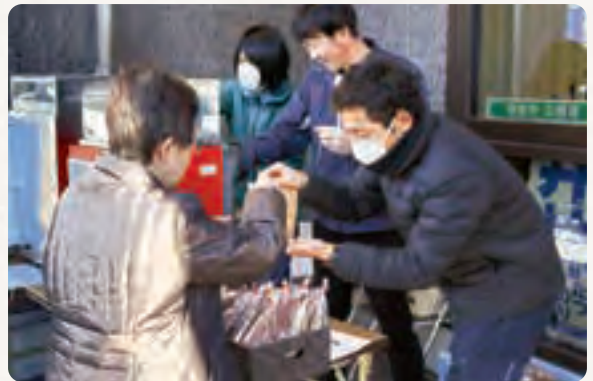
焼き芋を手渡すJA職員⑥

営農企画課は、年金支給日に合わせて住吉支店で焼き芋を販売しました。原料のサツマイモは、同課が農業経営事業で栽培した「べにはるか」で、240本お買い上げいただきました。焼き芋は、本店エントランスにて販売しております。本店にお越しの際や、金融部ATMをご利用の際は、ぜひお買い求めください。