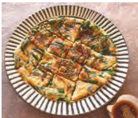
ニラチヂミ (韓国風お好み焼き)