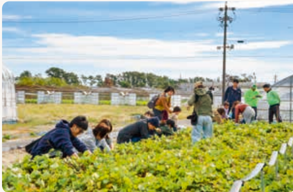
サツマイモを収穫する参加者ら

金融部ローンセンターは、住宅ローン利用者を対象にサツマイモの収穫体験を行いました。営農企画課が管理する畑で行い、6組22人が参加しました。家族で「大きいのがとれたね」「ここにたくさんあるよ」と声を掛け合いながら収穫を楽しむ様子が見られました。収穫体験は、JAの総合事業を生かし、農業の楽しさを知ってもらうために企画され、今年で11年目になりました。