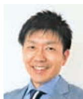
気象予報士・防災士 檜山靖洋 ひやまやすひろ

1973年横浜市生まれ。 明治大学政治経済学部政治学科を卒業後、印刷会社に就職。 1999年に気象予報士を取得し気象会社へ転職。 2005年からNHKの気象キャスターに。 朝のニュース番組「おはよう日本」の気象情報に出演中。