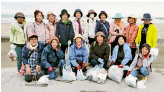
参加者の記念撮影

女性部は、ハイナンウォーカーSDGs企画「プロギング」を開きました。16人が参加し、ウォーキングを楽しみながら静波海岸のゴミを拾いました。参加者らは「こんなにゴミが落ちているとは思わなかった」「きれいになってよかったです」と話しました。