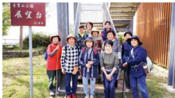
参加者の記念撮影

女性部はウォーキングクラブ「ハイナンウォーカー」を開き、沼津市の香貫山をウォーキングしました。山頂の展望台から駿河湾や富士山を眺めながら秋を満喫しました。