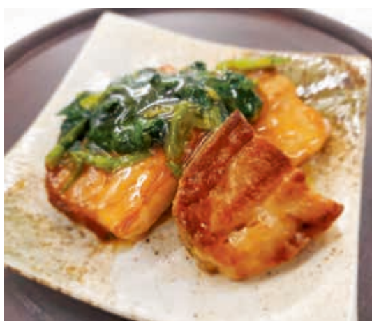
豚バラのホウレンソウあんかけ