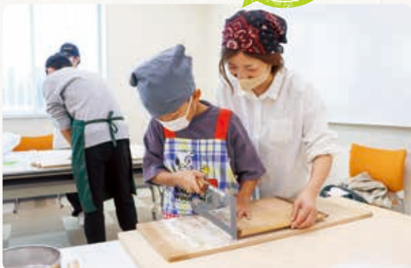
生地を切る参加者

萩間支店は、萩間地区の子どもたちを対象にそば打ち体験会を開きました。萩間地区絆づくり蕎麦チームから講師を招き、親子や支店職員ら約20人が参加しました。参加者は、粉に少しずつ水を入れる「水まわし」から、のした生地を板に沿って切る「切り」の作業まで体験し、「難しかったけれど、おもしろかったです」「貴重な体験ができました」と話しました。